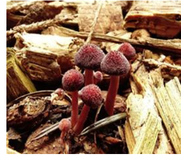
Gymnopilus dilepis (Wob Veenhoven)

Opnieuw is er een vindplaats ontdekt van de uiterst zeldzame Gymnopilus dilepis (nog geen Nederlandse naam), dit keer in Boswachterij Schoonloo in Drenthe. Deze exotische vlamhoed groeit op snippers van naaldhout en is mogelijk meegekomen met hout uit Sri Lanka. In 2018 werd de soort voor het eerst ontdekt. In Nederland. Dit is inmiddels de derde geregistreerde vondst voor Nederland. Verspreidingsatlas