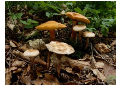
Lariksspijkerzwammen (Marian Jagers)

Enkele weken geleden werden in Boerskotten te Losser drie nieuwe groeiplaatsen gevonden van de in Nederland uiterst zeldzame Lariksspijkerzwam. Na de Lonnekerberg te Enschede, waar de soort na 42 jaar afwezigheid in 2008 weer werd gevonden, is Boerskotten nu het tweede natuurgebied in Nederland waar de soort voorkomt. Natuurbericht