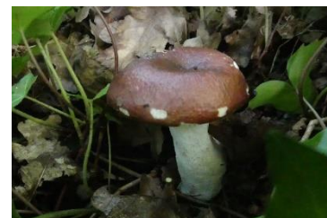
Donkere geelplaatrussula (Carolien Reindertsen)

Op 10 juli vond Carolien Reindertsen de zeldzame Donkere geelplaatrussula in een kleibosje bij Lienden. Bijzondere Waarneming