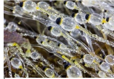
Pilobolus oedipus (Math Driessen)

Een van de eerste schimmels die op verse mest verschijnen zijn de kogelschieters. Deze bijzondere zwammen lijken op kleine kanonnen, omdat ze hun sporenpakketjes weg kunnen schieten. In juli 2020 is in Landgraaf een nieuwe soort voor Nederland gevonden: Pilobolus oedipus . Deze schimmel heeft nog geen Nederlandse naam. Natuurbericht