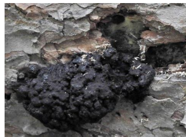
Bultig dropkussen op Grove den (Mark Smeets)

Slijmzwammen worden vaak gezien als een bepaalde groep zwammen, maar dat is niet het geval. Ze nemen een eigen plek in onder de amoëbe-achtige organismen. In dit natuurbericht leggen de auteurs uit hoe dat zit met slijmzwammen en het zeldzame Bultige dropkussen. Natuurbericht