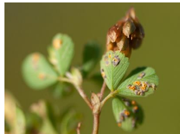
Gladde klaverroest (Erik Slootweg)

Afgelopen mei werd er een waarneming gemeld van de Gladde klaverroest ( Uromyces minor ) Dit was voor het eerst sinds 2002, toen de soort voor het eerst in Nederland werd aangetroffen op Ijsseloog (Ketelmeer). Sinds afgelopen mei zijn er nog meerdere meldingen binnengekomen van deze prachtige roest op klaversoorten. Kunnen we hieruit opmaken dat de Gladde klaverroest aan een opmars bezig is in ons land? Of wordt er steeds beter naar roesten gekeken? Waarneming