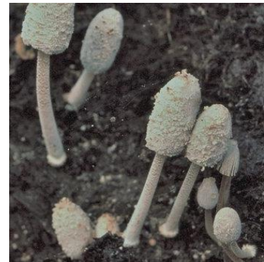
Driesporige inktzwam

Voor fanatieke paddenstoelenliefhebbers valt er in droge zomers soms weinig te beleven. Gelukkig kunnen we dan in een verloren hoekje nog altijd een klein paddenstoelentuintje aanleggen. Met een beetje mest van paarden of runderen is dat in een ogenblik gebeurd. Wil je daar meer over weten? Lees dan eens dit natuurbericht. Natuurbericht