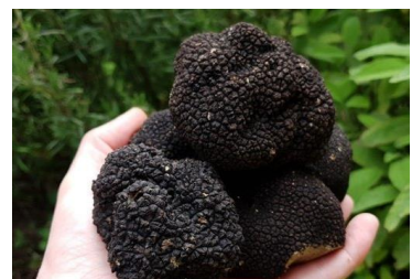
Tuber aestivum (Gerard Koopmanschap)

In de afgelopen twee jaar zijn op verschillende plaatsen in Nederland diverse nieuwe truffelsoorten ontdekt. In de meeste gevallen ging het om de Zomertruffel. De Zwarte wintertruffel werd in het rivierengebied aangetroffen en Tuber mesentericum (nog geen Nederlandse naam) in Zuid-Kennemerland. Het zijn drie zwarte truffelsoorten met een krachtig en herkenbaar aroma. Natuurbericht