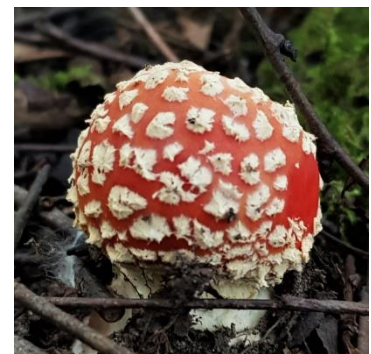
Vliegenzwam (Carly Freeman)

Op 22 juli werden alweer de eerste Vliegenzwammen van dit jaar gemeld op waarneming.nl. Een gezelschap daar trof aan het einde van hun wandeling een groepje jonge Vliegenzwammen aan op het vochtige gedeelte van natuurgebied Kwintelooijen bij Rhenen. Nadien zijn er nog meer vondsten gemeld op de paddenstoelengroepen op Facebook en op waarneming.nl.