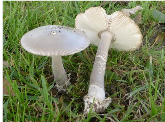
Dubbeltangeramaniet of Grijsze slanke amaniet? (Aldert Gutter)