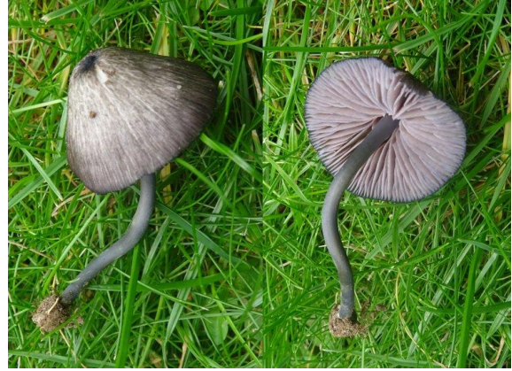
Violetgroene satijnzwam (Reimund & Finy Salzmänn)

De afgelopen jaren hebben leden van de Paddenstoelen-studiegroep Limburg bijzondere en voor Nederland nieuwe soorten staalsteeltjes aangetroffen in een kalkrijk grasland in Nijswiller-Noord. Lees hier meer over die bijzondere staalsteeltjes Natuurbericht