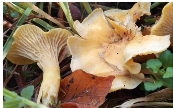
Roestvlekkencantharel (Melchior van Tweel)

In het centrum van Zwolle werd tijdens een paddenstoelen-inventarisatie de zeer zeldzame Roestvlekkencantharel ( Cantharellus ferruginascens ) aangetroffen. Lees hier meer over deze bijzondere vondst Natuurbericht