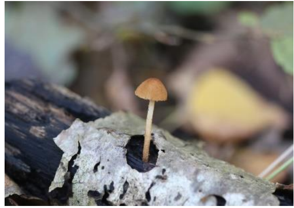
Franjevloksteeltje (Henk van der Wijngaard)

Tijdens een excursie met de paddenstoelenwerkgroep Zeeland, ontdekte Henk van der Wijngaard het zeer zeldzame Franjevloksteeltje ( Flammulaster muricatus ) op een stukje berkenhout. Henk Remijn heeft de vondst microscopisch bevestigd. De soort is slechts bekend van drie atlasblokken en staat als ernstig bedreigd op de Rode lijst (2008). Lees meer Bijzondere waarneming