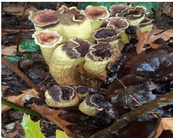
Misvorming (fasciatie) bij Gewone zwavelkop

Ook bij paddenstoelen kunnen bijzondere misvormingen voorkomen. De afgelopen maand werden er twee van dit soort misvormingen gemeld. Hoe ze precies ontstaan, is niet altijd duidelijk; mogelijk gaat het om een aangeboren (teratologische) afwijking waarbij aantasting door andere micro-organismen zoals virussen of schimmels, of aantasting door insecten een rol speelt. Zwammen kunnen hierdoor de meest bizarre groevormen aannemen. Op de linkerfoto ziet u een misvormde Gewone zwavelkop ( Hypholoma fasciculare ) met een afwijking die fasciatie wordt genoemd - het lijkt alsof stelen met elkaar vergroeid zijn - en rechts een misvorming bij de Gewone fopzwam ( Laccaria laccata ) die als morchelloïd (morielje-achtig) bekend staat.