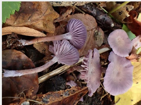
Amethistzwam (Melchior van Tweel)

De Amethistzwam is gekozen tot paddenstoel van het jaar 2024. De Nederlandse Mycologische Vereniging heeft het initiatief genomen om zoveel mogelijk vindplaatsen van de Amethistzwam in kaart te brengen. Ook wil zij onderzoeken hoeveel arseen deze paddenstoel bevat. Lees hier alles over De Paddenstoel van het Jaar