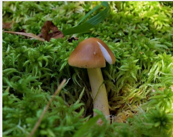
Roodbruine slanke amaniet (Piet Brouwer)

Vele vruchteloze wandelingen ten spijt werden er de laatste weken nauwelijks paddenstoelen gevonden. Het had geen enkele zin om door te zoeken, want zelfs in de meest beroemde paddenstoelenlanen werd niets gevonden behalve naaktslakken. Waarnemer Piet Brouwer ging naar de Crommenije, een moerasgebied in de Zaanstreek, en trof daar toch enkele paddenstoelen aan. Lees hier het hele Natuurbericht