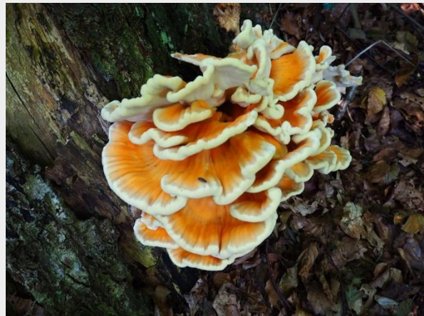
Zwavelzwam (Martijn Oud)

Hoewel de Zwavelzwam ( Laetiporus sulphureus ) ook wel op dood hout voorkomt, is hij vooral bekend als een geduchte parasiet van levende bomen. In Engeland is de Zwavelzwam een zeer gewaardeerde en veel gezochte consumptie-paddenstoel, getuige zijn bijnaam 'Chicken of the woods'. Zijn bijnaam refereert uiteraard niet aan zijn vorm, maar aan zijn overeenkomst in smaak en draderige structuur met kippenvlees. De zwavelzwam wordt hier wel als vervanger voor kippenvlees in vegetarische gerechten toegepast. Lees er alles over in dit Natuurbericht.