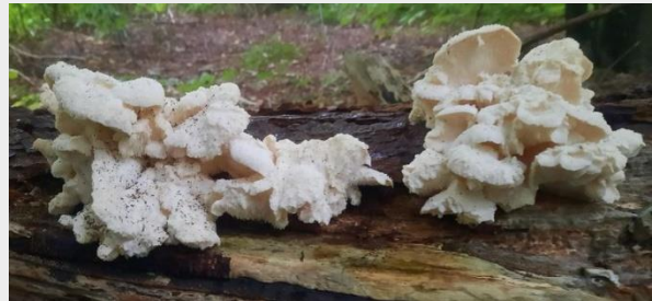
Gelobde pruikzwam (Martijn Oud)

Tijdens excursies treffen we de laatste weken veel slakken en geen paddenstoelen. Totdat we een liggende dode stam van de Paardenkastanje tegenkwamen, met daarop een paar mooie Gelobde pruikzwammen. De Gelobde pruikzwam is in onze regio zonder meer zeldzaam, de laatste vondst dateert van 18 augustus 2009. Lees hier het excursieverslag van Martijn Oud.