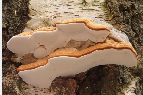
Echte tonderzwam (Aldert Gutter)

Ondanks het bloedhete weer besloten we erop uit te gaan op zoek naar paddenstoelen. Een wandeling in een bos onder een schaduwrijk dicht bladerdek leek ons gezien de weersvoorspellingen een aantrekkelijk alternatief. Aangekomen in het bos bleek het vooral onder de beuken goed teeven, maar paddenstoelen waren er nauwelijks te vinden. Houtzwammen waren er wel, waaronder de Echte tonderzwam. Lees hier het hele verslag.