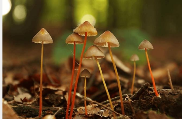
Prachtmycena (Ronald Morsink)

Paddenstoelen fascineren en vervullen een sleutelrol in de natuur. Deze herfst organiseren Paddenstoelenonderzoek Nederland en de Nederlandse Mycologische Vereniging twee online cursussen op de Soortenacademie. Een laagdrempelige Opstapcursus van vijf lessen en een Basiscursus van dertien lessen, waarin je paddenstoelen op naam leert brengen. Lees er meer over in dit artikel.