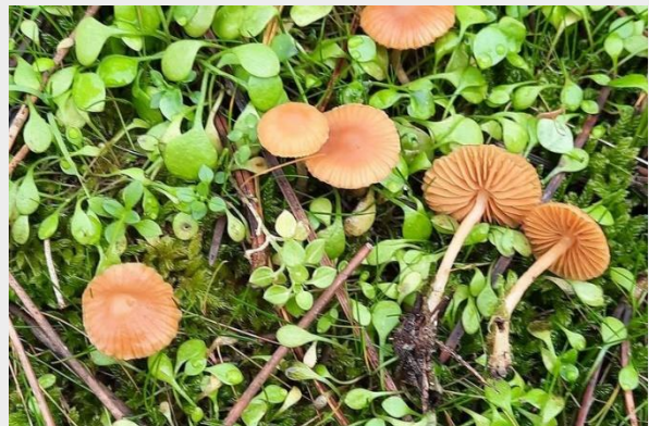
Naaldbosmosklokje (Martijn Oud)

Een zachte winter leent zich bij uitstek om eens aandacht te schenken aan de meer veronachtzaamde paddenstoelen. Elke in paddenstoelen geïnteresseerde persoon heeft zo zijn favoriete soorten, maar er zijn ook soorten die er meestal bekaaid van afkomen als het gaat om aandacht. Ook mosklokjes worden vaak genegeerd, zeker als er veel paddenstoelen staan en er keuzes gemaakt moeten worden. Lees er alles over in dit artikel