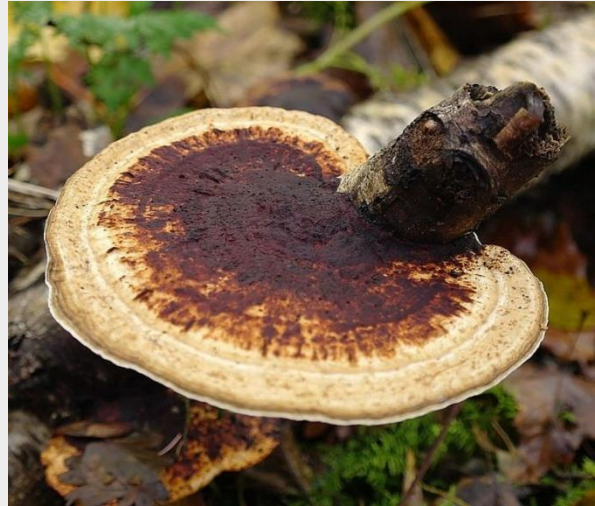
Roodporiehoutzwam (Martijn Oud)

Ondanks de vrieskou zijn sommige werkgroepen er toch telkens weer op uitgegaan om vooral niets te missen van de zogenaamde winterhoutzwammen. De Roodporiehoutzwam en de Roodplathoutzwam zijn geen echte winterpaddenstoelen, maar wel degelijk in aantal in de winter te vinden. Door de elementen die horen bij het winterseizoen, worden deze twee soorten weliswaar getekend, maar blijven nog prima herkenbaar. Lees hier het hele artikel