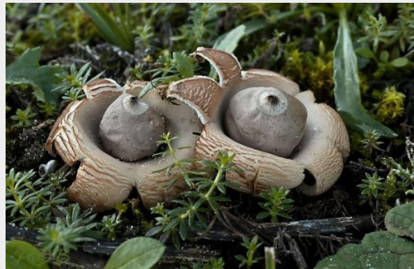
Viltige aardster (Piet Brouwer)

De laatste jaren komt het steeds vaker voor dat er zelfs in de wintermaanden aardsterren worden gevonden. Zo ook in deze kwakkelwinter. Er werden soorten als de Peperbus, de Baret-aardster en de Forse aardster gevonden, en zelfs de Viltige aardster. Allemaal toevallige vondsten want er werd niet gericht naar gezocht. Lees er meer over in dit Natuurbericht