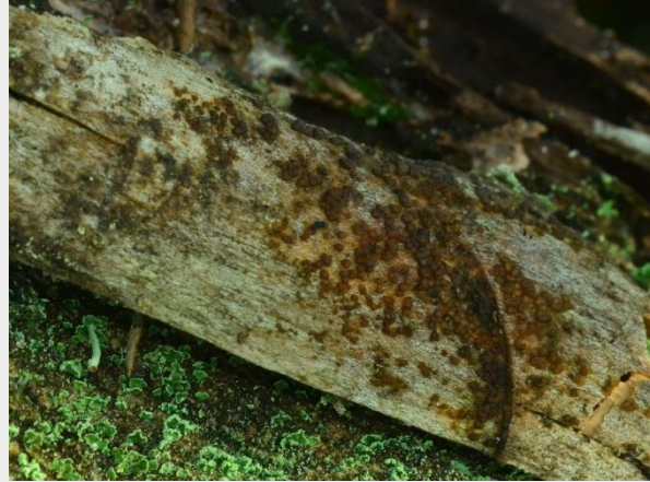
Eensporige druppelzwam (Leonard Minkema)

Wederom een leuke vondst van Leonard Minkema in de Schoorlse duinen. Op 21 februari trof hij daar de zeer zeldzame (zzz) Eensporige druppelzwam aan. De soort is slechts bekend van twee atlasblokken voor ons land. Gefeliciteerd met deze mooie vondst Leonard!