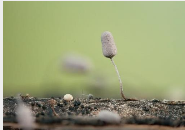
Langstelig dwergkroeskopje