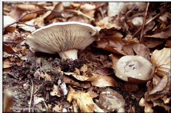
Korststelige veldridderzwam (Martijn Oud)

Het weer is soms nog steeds wat koud en kil, want “maartse buien die beduiden dat het voorjaar aan komt kruien”. Een zeer oud gezegde, maar een waarheid als een koe. Toch zijn er wel degelijk mooie veldridderzwammen te vinden die de maartse weergoden met gemak weten te doorstaan. Dit zijn de Kortstelige en de Okerkleurige veldridderzwam. Dit duo is helemaal niet vies van een maarts buitje. Lees hier het volledige artikel.