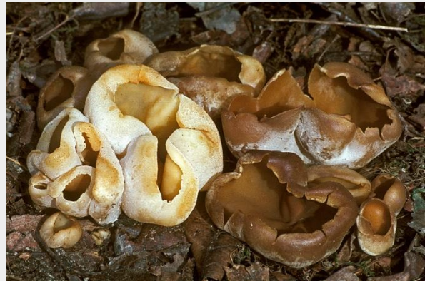
Vroege bekerzwam (Henk Huijser)

De PvdM van april is de Vroege bekerzwam