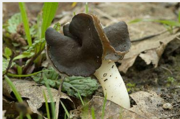
Nonnenkapkluiwzwam (Piet Brouwer)

De A8 is een snelweg waar je kans maakt op diverse zeldzame paddenstoelen, zoals de Geaderde kluiwzwam. Het totale oppervlak van bermen, snelwegen en verkeerspleinen in ons kleine landje is groot. Toch wordt er nauwelijks onderzoek verricht naar de natuurwaarden van dit extreme biotoop. Lees er alles over in dit Natuurbericht