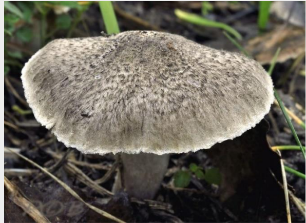
Zilvergrijze ridderzwam (Piet Brouwer)

De Zilvergrijze ridderzwam werd in het verleden wel meer tot in januari gevonden, maar eind januari? De datum van deze vondst is opvallend en later in het jaar dan verwacht, en dus bijzonder. Het feit dat het in de stad een paar graden warmer is dan buiten de stad zal ook een rol van betekenis zijn. Over een paar weken komen waarschijnlijk de eerste voorjaarssoorten tevoorschijn, tenminste, als het weer niet verandert. Zie hier het Natuurbericht