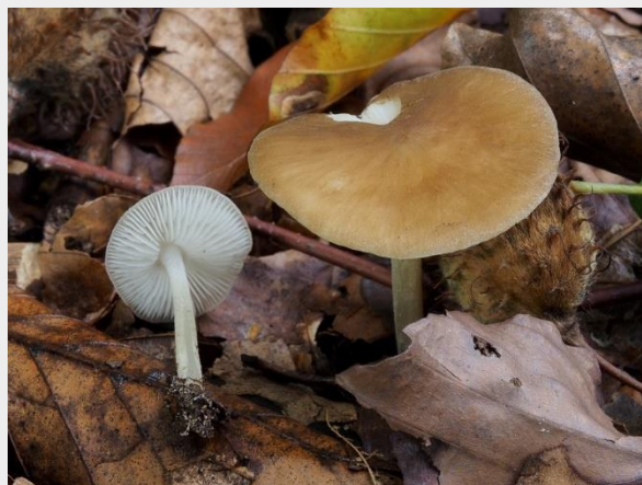
Geelbruine sapsteel (Ton Hermans)

In een bosje bij Erp werd op 18 april, voor het achtste jaar op rij, de Geelbruine sapsteel aangetroffen. De Geelbruine sapsteel is een zeer zeldzame soort (ZZZ) en staat als Gevoelig (GE) op de Rode lijst (2008). Lees hier alles over deze Bijzondere waarneming