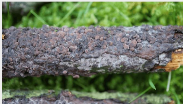
Orbivator quercinae (Marian Jagers). Een nieuwe trilzwam voor Nederland

Een grote natuurbrand in 2022 legde tientallen hectares natuur in de as op de Sallandse Heuvelrug. Een drie jaar durend onderzoek naar brandplekpaddestoelen heeft een groot aantal soorten opgeleverd, en ook een nieuwe paddenstoelensoorst voor Nederland. Wat lange tijd leek op een dood zwartgeblakerd landschap, bleek juist heel aantrekkelijk voor tal van brandplekpaddestoelen en diersoorten. Lees er meer over in dit Natuurbericht