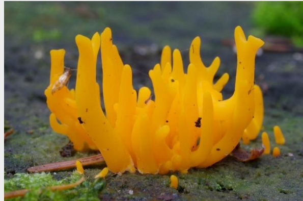
Kleverig koraalzwammetje (Gio van Bernebeek)

De PvdM van juli is het Kleverig koraalzwammetje