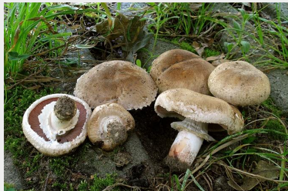
Wilde vorm van de Gekweekte champignon