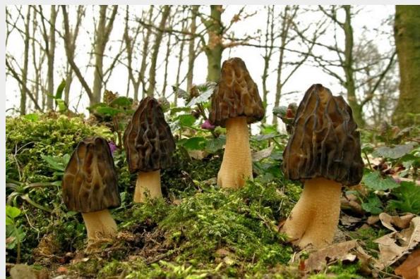
Kapjesmorielje (Henk Huijser)

De herfst is in Nederland het paddenstoelen-seizoen bij uitstek. Ook in het voorjaar komen paddenstoelen boven de grond. Daar zijn soorten bij die je bijna jaarrond kunt tegenkomen, zoals de zwavelkop. Er verschijnen ook veel soorten die juist in de lente hun optimale groeiseizoen hebben. We maken nu de balans op. Hoe reageren de voorjaarssoorten op een droog voorjaar? Lees er meer over in dit Natuurbericht .