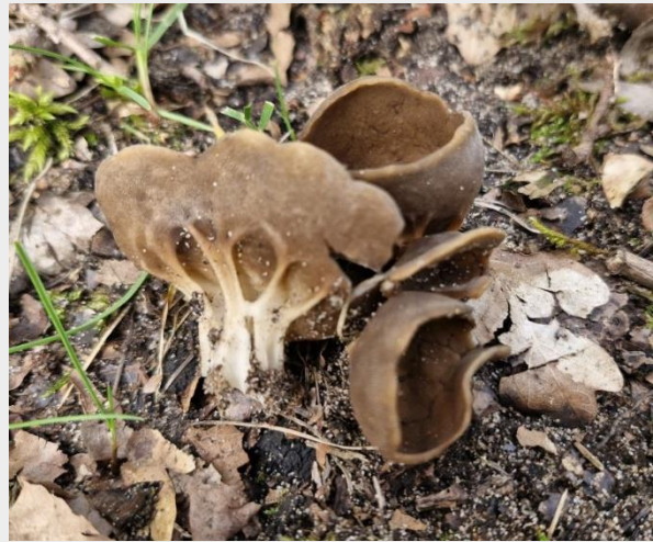
Bokaalkluifzwam (Carolien Reindertsen).

Bloemen, vogels, vlinders, in het voorjaar komt het buiten weer tot leven. En hoewel je dat misschien niet verwacht, geldt dat ook voor paddenstoelen. Bepaalde soorten komen vrijwel alleen in het voorjaar boven de grond. Zoals de aantrekkelijke groep van de voorjaarskluifzwammen. Met name de wonderlijke vorm maakt ze bijzonder fotogeniek. Maar waar blijven ze dit jaar? Lees er alles over in dit artikel.