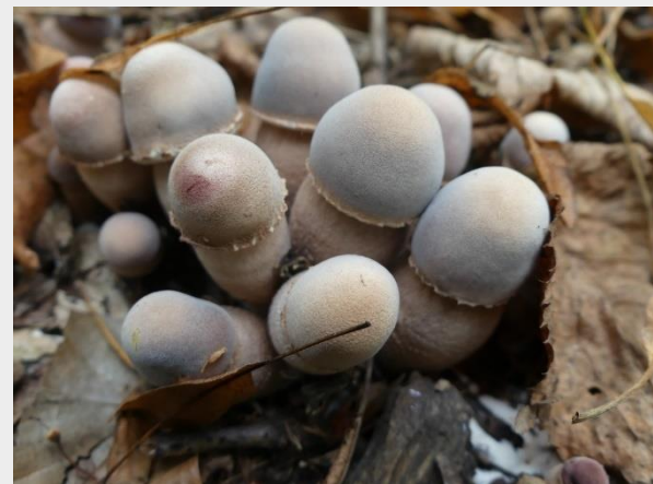
Gebundelde champignonparasol