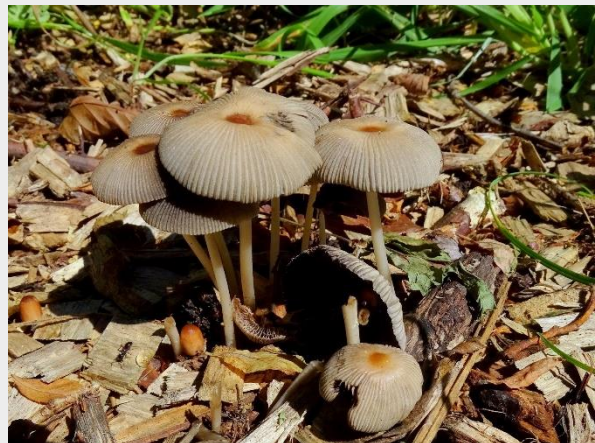
Groot mestplooirokje (Joop Verburg)

Op 10 juni vond Joop Verburg het zeer zeldzame (zzz) Groot mestplooirokje. De soort is slechts bekend van zes atlasblokken in ons land en staat te boek als gevoelig (GE) op de Rode lijst (2008). Lees hier alles over deze Bijzondere waarneming .